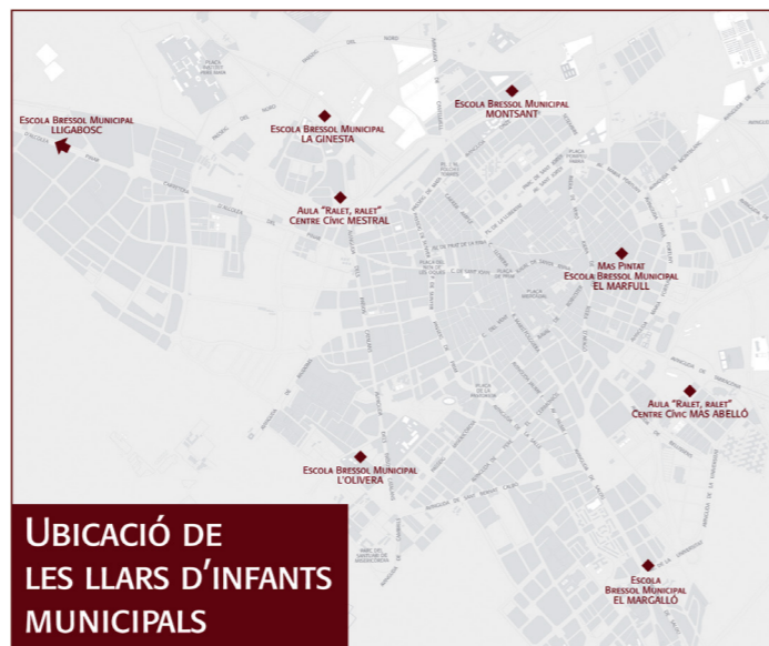
UBICACIÓ DE LES LLARS D'INFANTS MUNICIPALS

A la ciutat de Reus aleshores ja existia una oferta municipal de 41 places a l'Escola Bressol Municipal La Ginesta, a les quals el nou Mapa afegia la previsió de crear 5 escoles bressol municipals més que suposaven 380 places, amb la qual cosa se superava amb escreix les places que el Govern de Catalunya havia previst per a Reus. En aquest sentit, l'Ordre EDC/E236/2005, de 26 de maig, desenvolupà el nou marc acordat i el futur repartiment de l'oferta de places de les escoles bressol municipals (EBM) de Reus. Aquesta oferta és la que s'ha traduït en el mapa actual d'escoles bressol municipals. El marc legal que sustenta el funcionament de les escoles bressol es recull en el Decret 282/2006, de 4 de juliol, pel qual es regula el primer cicle de l'educació infantil i els requisits dels centres.