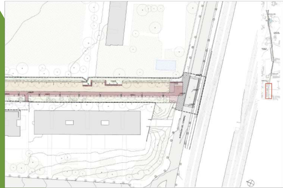
AV. DEL COMERÇ

Se'n reforça la presència al llarg del passeig amb baranes que en faciliten l'accés i fan funció de mirador.