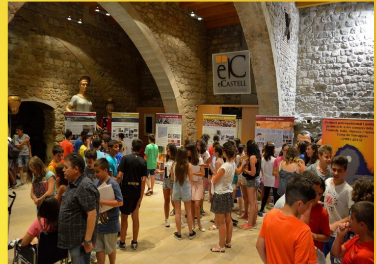
Ejemplo del tipo de plafones utilizados en la exposición

➤ Complementada con interesantes reproducciones de objetos prehistóricos.