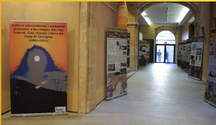
Ejemplo del tipo de plafones utilizados en la exposición

➤ Adaptable a todos los espacios y con muy fácil transporte y rápido montaje.