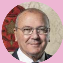
Carles Pellicer i Punyed Alcalde de Reus