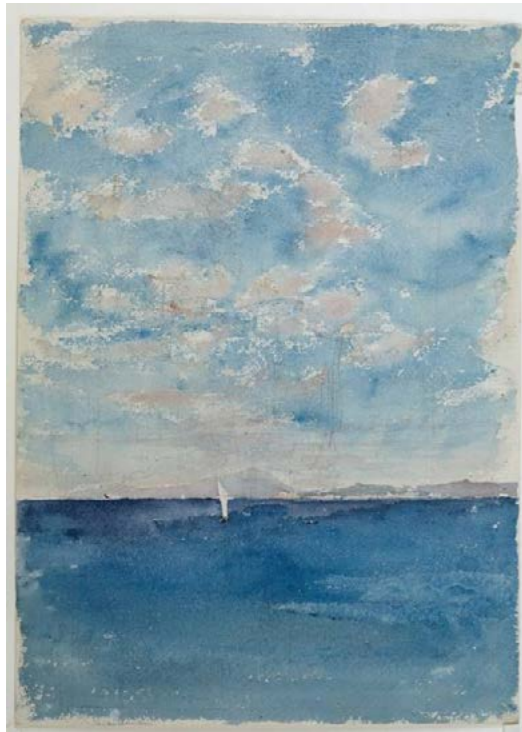
Mar, al fondo el Vesubio 1874 Aquarel·la sobre paper Museo Nacional del Prado

Sense abusar de les fórmules formalistes anquilosades, la mostra també inclou treballs que destaquen per ser exercicis molt brillants del més genuí il·luminisme. L'interès pels efectes de la llum solar, per exercitar-se en la pràctica de l'observació de la natura i com aquesta condiona la nostra percepció visual, són elements físics que tenen un alt pes específic en l'obra del reusenc. Sense oblidar, encara que pugui semblar una boutade, del seu gust pel conreu del paisatgisme, sense incórrer però en la visió restringida, ni en les convencions característiques del gènere. Per ell la pràctica del paisatgisme es planteja com una oportunitat per créixer professionalment o, fins i tot, com una experiència catàrtica que el va ajudar a superar determinats períodes de crisi creativa.