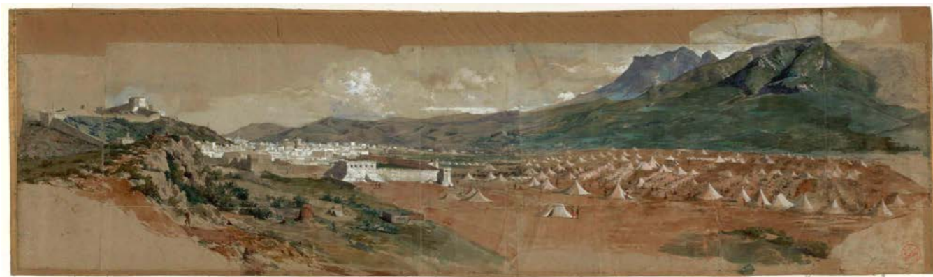
Vista de Tetuan 1860 Aquarel·la i guaix sobre paper MNAC 45971-D