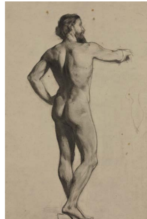
Nu masculí Cap a 1858-1859 Llapis conté sobre paper 44,5 x 29,5 cm Museu de Reus (MR 57)

En aquest sentit, la selecció d'obres que es presenta en aquesta exposició, totes elles provinents de les col·leccions que conserven el Gabinet de Dibuixos i Gravats del Museu Nacional d'Art de Catalunya i el Museu de Reus, permeten fer un recorregut per les diferents etapes que conformen l'activitat de l'artista de Reus. D'aquesta manera, en termes formals, ens trobem en presència tant de produccions pertanyents al període