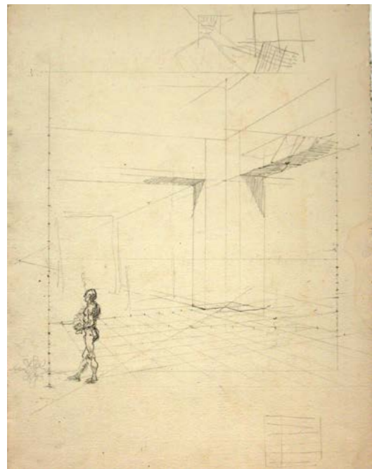
Estudi de perspectiva i figura masculina Cap a 1863-1868 Llapis grafit sobre paper 32,4 x 23 cm MNAC 105821-D

«Amb l'edat creix la seva afició pel dibuix, al qual dedica moltes hores. Copia, observa, recorda, s'exercita prenent apunts del natural, omple de gargots informes les parets, les cobertes dels seus llibres, les taules dels cafès... dibuixa i pinta intensament del natural, al carrer, al camp, utilitza els dies festius, les hores d'esbarjo: grava, il·lumina fotografies, dibuixa a la pedra litogràfica; la seva activitat abraça les diverses branques de l'art del dibuix».