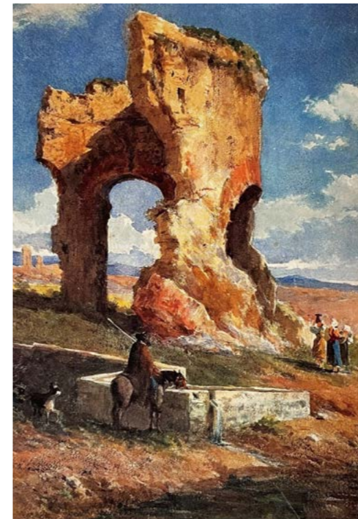
Ruïnes romanes a prop de Cervera 1863-1865 Aquarel·la sobre paper Museu de Reus (MR 7)