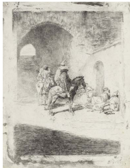
Guàrdia de la qasha a Tetuan Cap a 1861 Aiguafort sobre paper 21,8 x 16,9 cm MNAC 7287-G