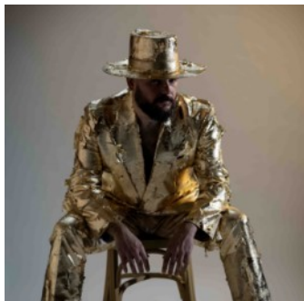
Figura clau del flamenc contemporani, Niño de Elche ha assumit l'essència del gènere flamenc en totes les seves dimensions, des del més elemental fins al més essencial. Aquesta actitud l'ha portat a proclamar-se ex flamenc , una forma d'expressar la seva recerca inacabable per explorar i redefinir les fronteres de l'art. Ara, en el moment culminant d'aquesta recerca, presenta el capítol final d'una trilogia que inclou els àlbums Memorial de cante en mis bodas de plata con el flamenco (2021) i Flamenco. Mausoleo de celebración, amor y muerte (2022).

Amb el llançament de Cante a lo gitano , disponible des de l'11 d'octubre, Niño de Elche ofereix una reescolta del repertori de Manuel Torre (1880-1933), el mític cantaor que va deixar empremta amb una veu austera però d'una personalitat artística inconfusible. A través de catorze cants profundament intensos, l'artista ens retorna als orígens ancestrals del flamenc, portant-nos cap al futur del gènere.